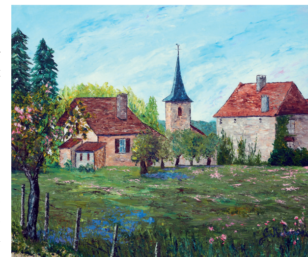
Village d'Abitain (Béarn) 61x50 cm