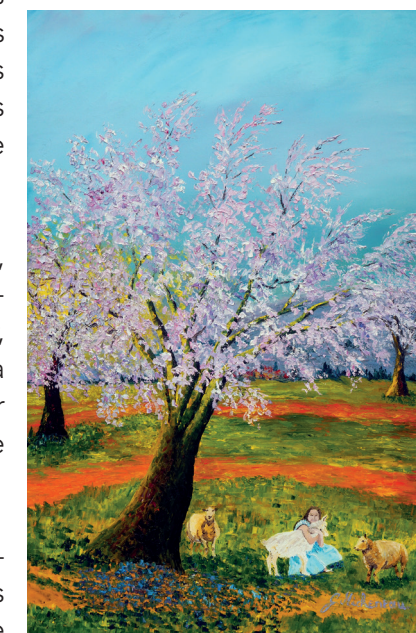
Amandiers en fleurs- Hymne au printemps 100x65 cm