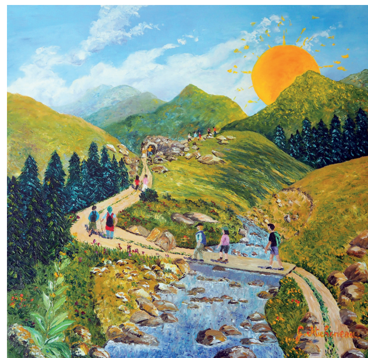
Montée vers l'au-delà 80x80 cm