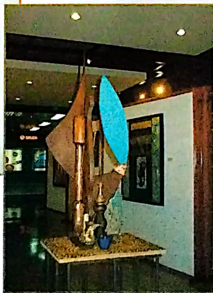
"Café Gourmet", escultura de Alexis Higuera