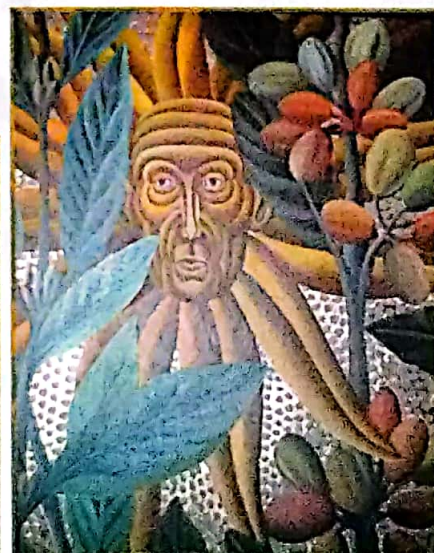
"Estudio No. 1" de Henry Bermúdez, otra de las pinturas exhibidas en la estación Bellas Artes