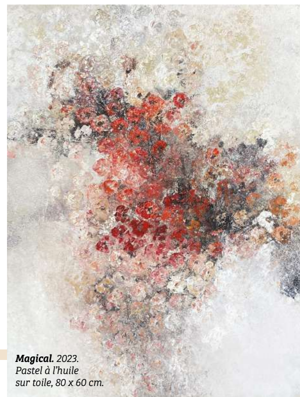
Magical. 2023. Pastel à l'huile sur toile, 80 x 60 cm.

L'effet d'empatement de ses œuvres provient de l'utilisation du couteau pour appliquer la peinture sur la surface de la toile, donnant à chaque touche un caractère sculptural. Mon travail au couteau est directement influencé par son style de peinture. ● L'américaine Joan Mitchell, mon artiste féminine préférée, a comme moi élu domicile en France. Elle savait aborder la peinture avec une liberté totale, sans plan définitif. Une démarche encore très difficile pour moi, qui veux toujours avoir un plan ! Son travail me donne envie de laisser mon cerveau droit s'emballer pour éprouver la joie totale qu'elle ressentait en peignant. ● L'un des pionniers de l'art abstrait moderne, Wassily Kandinsky, pensait que la couleur influence directement l'âme. Je suis d'accord avec cette idée et je crois être aussi obsédée par la couleur que lui. Jouer avec les pigments sur la toile me remplit d'une joie totale. Quand certaines femmes aimeraient des bijoux pour Noël ou leur anniversaire, je souhaite que l'on m'offre de la belle peinture à l'huile !