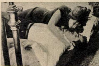
A bosszú angyala és a csábító

Reggel azonban annál inkább. Vincenzo tudniillik nem óhajtja feleségül venni Assuntát. És mivel tisztában van tetteinek következményével, gyorsan kerekét old, meg sem áll Angliáig. Assunta magára marad bánatával, csalódottságával, no meg persze a pletykával. Mert