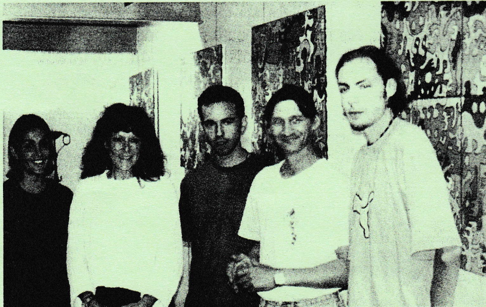
Des artistes divers et un travail cohérent.

À l'Office du tourisme de Cahors jusqu'au 1 er octobre, 4 artistes se sont donnés rendez vous avec de la couleur comme dénominateur commun.